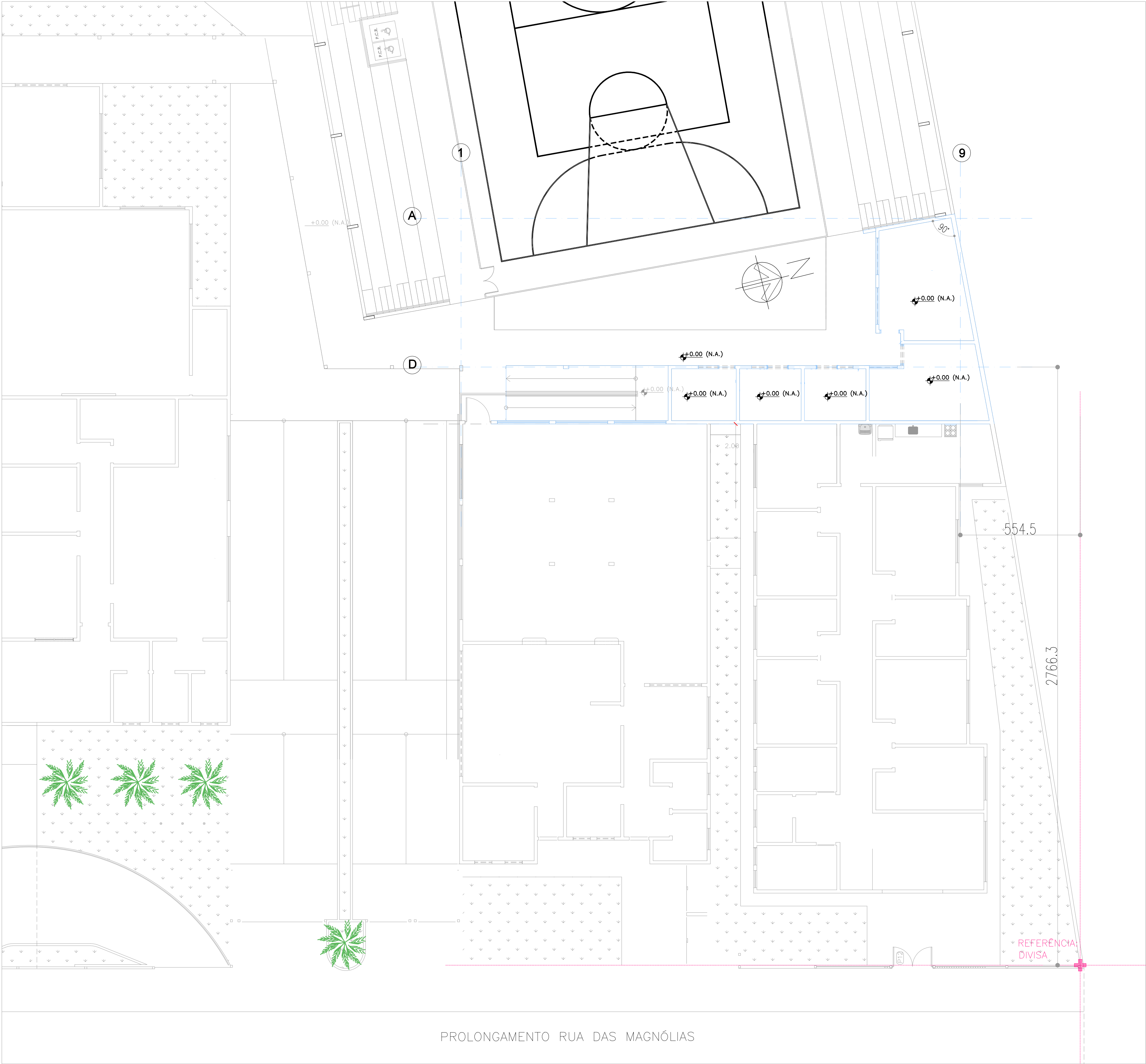
PLANTA DE IMPLANTAÇÃO - VESTIÁRIO ESCALA 1:100